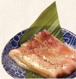
やわらかイカ焼き