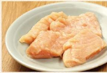
上ミノ [たれ又は味噌たれ]