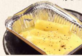
カルボナーラ トッポギ