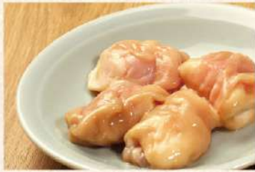
まるちょう [たれ又は味噌たれ]