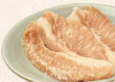
とんトロ [たれ又は塩]