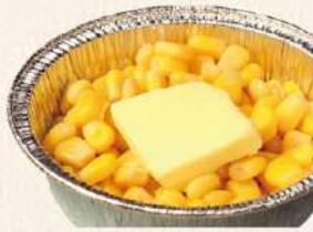
コーンバター ホイル焼き