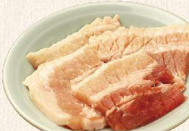
豚カルビ [たれ又は塩]