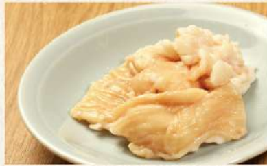
てっちゃん [たれ又は味噌たれ]