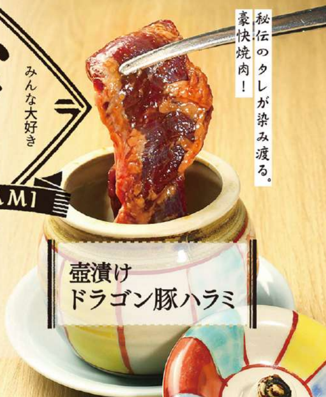
壺漬け ドラゴン豚ハラミ