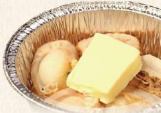
帆立の醤油バター ホイル焼き