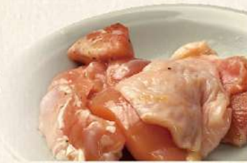
鶏もも焼き 〔炭火たれ又は塩〕