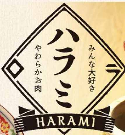
うし吟やわらかハラミ