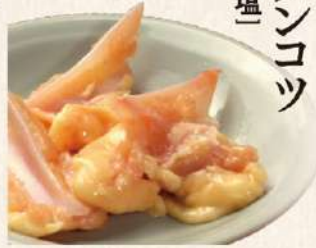
やげんナンコツ 〔炭火たれ又は塩〕