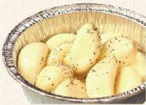
あつあつにんにく ホイル焼き