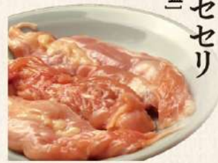
ぷりぷりセセリ 〔炭火たれ又は塩〕